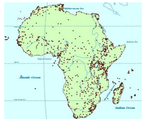
Réseau des ZICO en Afrique et les autres îles associées