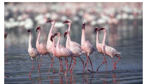
Flamants nains du lac Natron