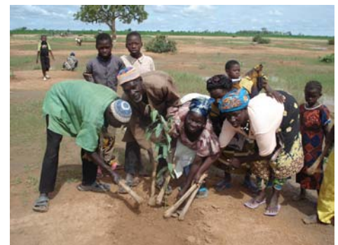
Restauration de la vallée du Sourou une ZICO au Burkina Faso