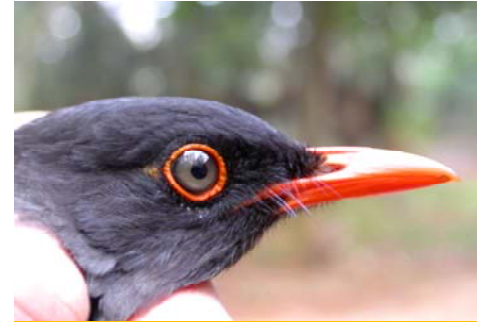
L'initiative de prévention d'extinction visant les espèces gravement menacées, par exemple Merle des Taita

Antoinette.Otieno@birdlife.org / Jane.Gaithuma@birdlife.org