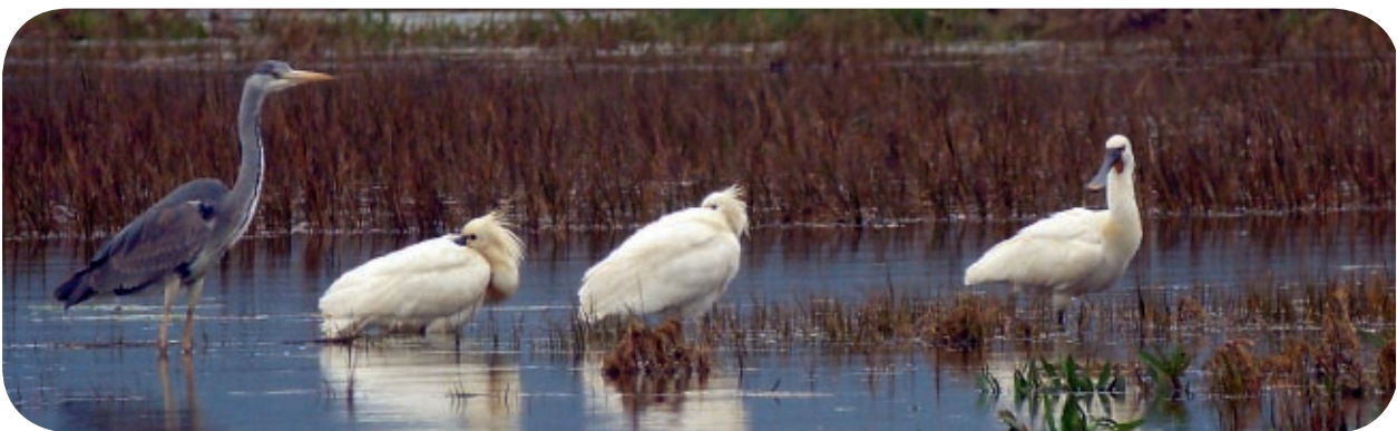
Garza real ( Ardea cinerea ) y espátulas ( Platalea leucorodia ) »