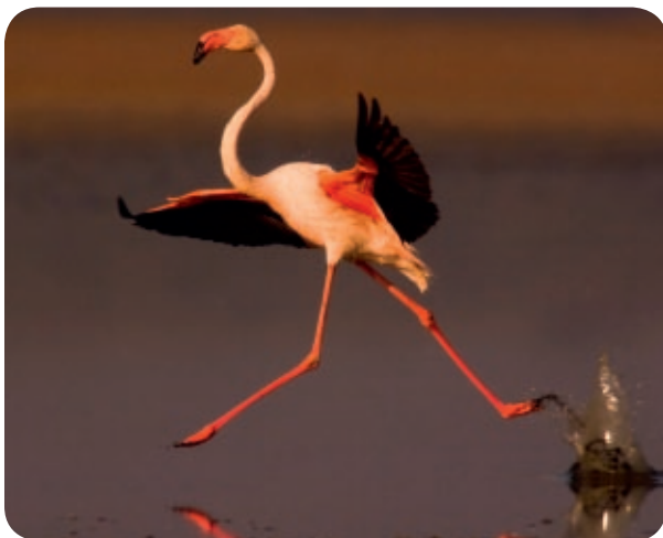
Flamenco común ( Phoenicopterus roseus ) »