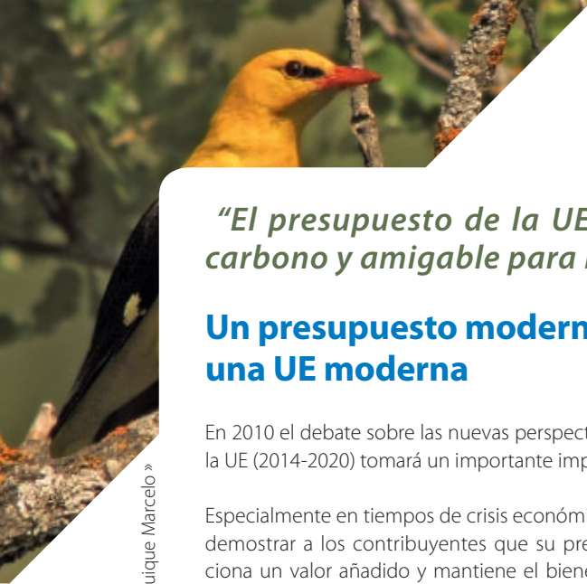
Oropéndola ( Oriolus oriolus ) »