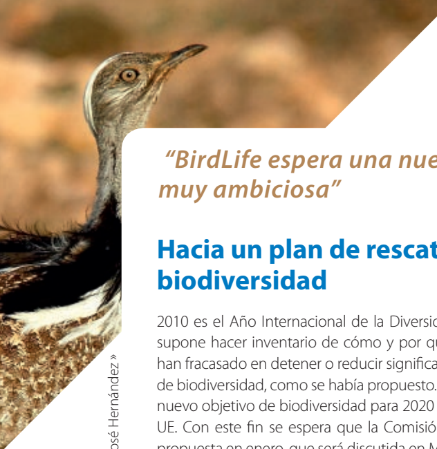
Hubara canaria (Chlamydotis undulata) © Juan José Hernández»

“BirdLife espera una nueva meta para 2020 que sea enérgica, mensurable y muy ambiciosa”