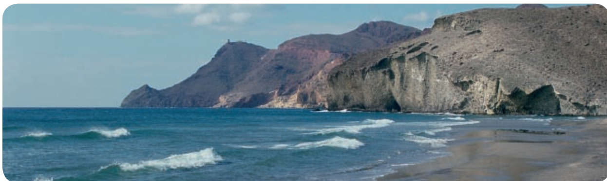
Cabo de Gata © J.L. Rodríguez/Ceneam-MARM »

Garcilla cangrejera ( Ardeola ralloides ) © Dani López Huertas »