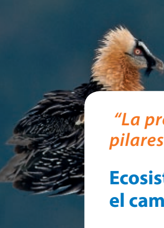
Quebrantahuesos ( Gypaetus barbatus ) © Carlos Sánchez mayadefilms.com »

“La protección de los ecosistemas y la responsabilidad pública deben ser los pilares centrales de la política del agua”