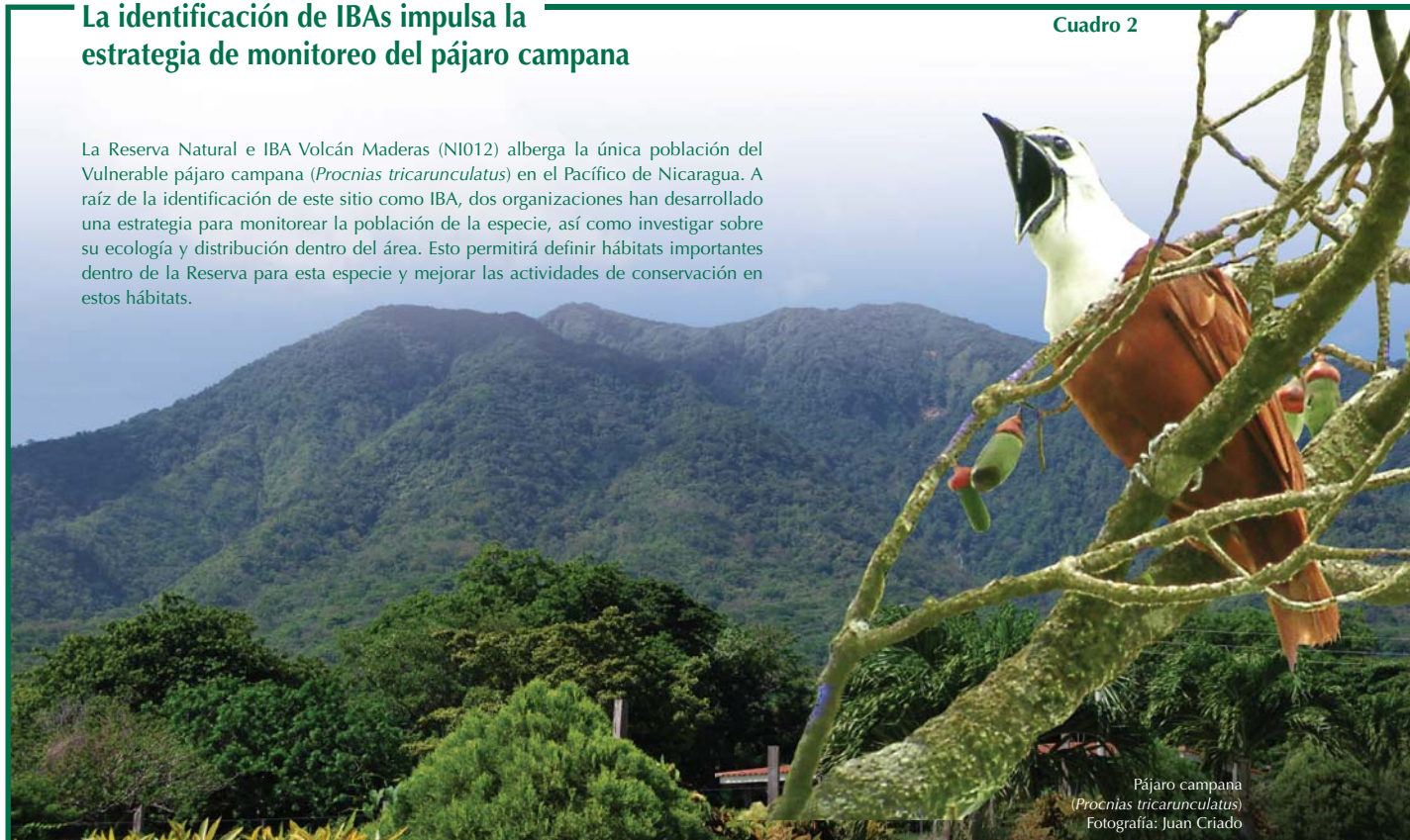
Pájaro campana ( Procnias tricarunculatus )

La Reserva Natural e IBA Volcán Maderas (NI012) alberga la única población del Vulnerable pájaro campana ( Procnias tricarunculatus ) en el Pacífico de Nicaragua. A raíz de la identificación de este sitio como IBA, dos organizaciones han desarrollado una estrategia para monitorear la población de la especie, así como investigar sobre su ecología y distribución dentro del área. Esto permitirá definir hábitats importantes dentro de la Reserva para esta especie y mejorar las actividades de conservación en estos hábitats.