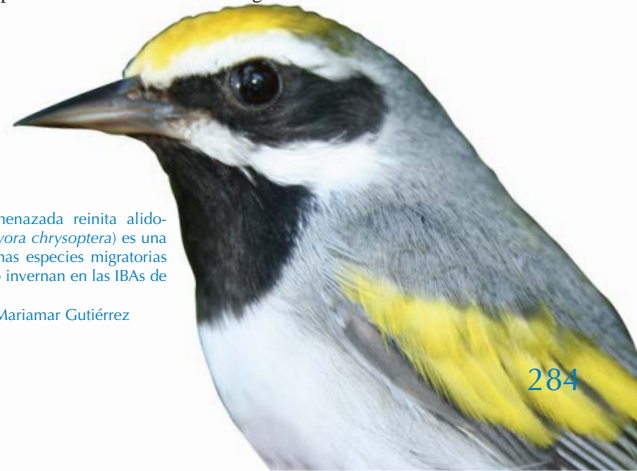
La Casi Amenazada reinita alidorada ( Vermivora chrysoptera ) es una de las muchas especies migratorias que pasan o invernan en las IBAs de Nicaragua.

De acuerdo a una recopilación preliminar Birdlife International (2006), en Centroamérica se registran un total de 210 especies migratorias neárticas (el 62% de todas las especies de América), de las cuales 190 especies han sido registradas en Nicaragua. 32 de ellas tienen poblaciones migratorias y residentes, 121 invernan en el país y 37 son transeúntes (Morales et al. 2007). Por regiones, se han registrado 126 en la región del Pacífico, 112 en el centro-norte y 96 en el Caribe. En la región del Pacífico 22 especies acumulan el mayor número de registros, entre las cuales podemos encontrar las cercetas aliazul ( Anas discors ) y común ( A. crecca ), el porrón menudo ( Aythya affinis ), los zorzales ustulado ( Catharus ustulatus ) y grande ( Hylocichla mustelina ) y el azulito multicolor ( Passerina ciris ). En la región centro-norte encontramos varias especies exclusivas de esta área, como las reinitas pechinegra ( Dendroica chrysoparia ) y atigrada ( D. tigrina ), así como el pocoyo gritón ( Caprimulgus vociferus ). La región del Caribe ha sido poco estudiada y no existen datos precisos sobre el estado las migratorias.