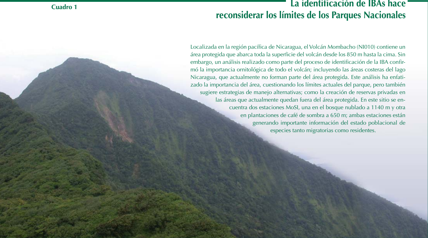
Volcán Mombacho (NI010)

Localizada en la región pacífica de Nicaragua, el Volcán Mombacho (NI010) contiene un área protegida que abarca toda la superficie del volcán desde los 850 m hasta la cima. Sin embargo, un análisis realizado como parte del proceso de identificación de la IBA confirmó la importancia ornitológica de todo el volcán; incluyendo las áreas costeras del lago Nicaragua, que actualmente no forman parte del área protegida. Este análisis ha enfatizado la importancia del área, cuestionando los límites actuales del parque, pero también sugiere estrategias de manejo alternativas; como la creación de reservas privadas en las áreas que actualmente quedan fuera del área protegida. En este sitio se encuentra dos estaciones MoSI, una en el bosque nublado a 1140 m y otra en plantaciones de café de sombra a 650 m; ambas estaciones están generando importante información del estado poblacional de especies tanto migratorias como residentes.