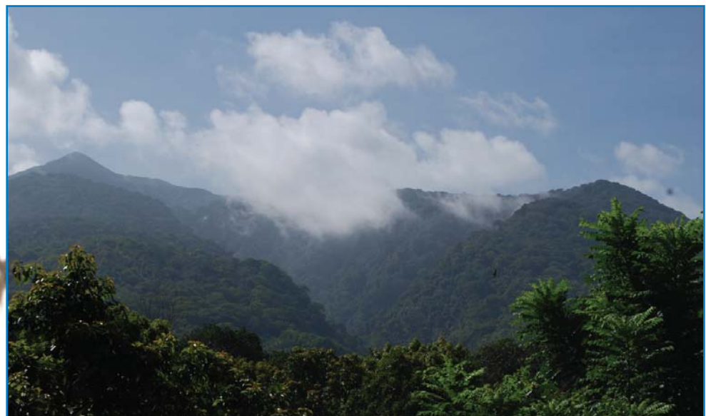
El Volcán Maderas (NI012) es un volcán durmiente en una isla del lago Nicaragua. La IBA mantiene seis especies restringidas a biomas.

Nicaragua puede dividirse en tres regiones, Pacífica, Central y Caribeña. En la primera se encuentran tres provincias geomorfológicas: las planicies costeras del Pacífico, la cordillera volcánica del Pacífico y la depresión Nicaragüense (MARENA 2007). Los tipos de vegetación de esta región incluyen bosques secos, nubosos, pinares, manglares y humedales, incluyendo lagunas en cráteres y zonas inundadas dulceacuícolas y salobres. La región central de tierras altas del interior de la es la zona más elevada del país, alcanzando los 2107 m; y tiene un relieve fuertemente accidentado constituido por altiplanicies, escarpadas laderas, serranías, y cordilleras y terrenos montañosos; encontrándose aquí los bosques nubosos más extensos del país, además de bosques húmedos tropicales y el límite sur del bosque de pino-encino de América. En esta misma zona nacen todos los ríos que drenan tanto al Pacífico como al Caribe. Las planicies costeras del Caribe presentan características onduladas, con colinas y bajas mesetas, planicies aluviales, zonas pantanosas y lagunas. Esta región mantiene la mayor área de bosque húmedo tropical en el país, junto con sabanas de pino, bosques de ribera y humedales (MARENA 2007). Nicaragua cuenta con la mayor área boscosa de Centroamérica, compartiendo con los otros países de la región casi todas las formaciones vegetales, así como la flora y fauna asociada a las mismas