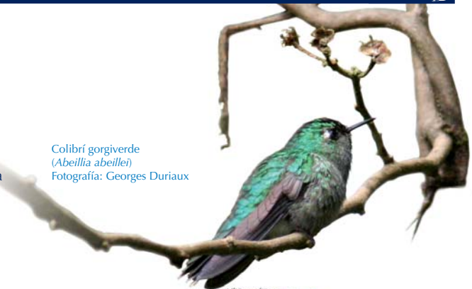
Colibrí gorgiverde ( Abeillia abeillei )