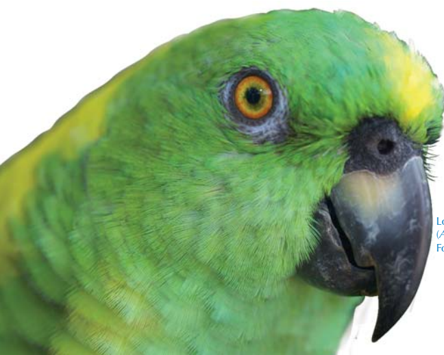
Loro nuquamarrillo ( Amazona auropalliata )

Las Áreas de Endemismo de Aves (EBAs) se identifican por ensamblajes de dos o más especies de rango restringido (con rangos de distribución menores a 50.000 km 2 ; ver Métodos). En Nicaragua se encuentran tres de las 78 EBAs presentes en América, así como un Área Secundaria; estas son la Vertiente Pacífica del Norte de Centroamérica (EBA 017), incluyendo especies como la chachalaca del Pacífico ( Ortalis leucogastra ) y la amazilia coliazul ( Amazilia cyanura ); las Tierras Altas del Norte de Centroamérica (EBA 018), con seis especies en Nicaragua, como la urraca pechinegra ( Cyanocorax melanocyanus ), la codorniz ocelada ( Cyrtonyx ocellatus ), el montañés pechiverde ( Lampornis sybillae ) y la chachalaca negra ( Penelopina nigra ); y 1 la Vertiente Caribeña de Centroamérica (EBA 019), con especies como el mosquitero pechileonado ( Aphanotriccus capitalis ), la cotinga nevada ( Carpodectes nitidus ), el hormiguerito pechirrayado ( Dysithamnus striaticeps ), el semillero Nicaragüense ( Oryzoborus nuttingi ), el saltarín cabecigrís ( Piprites griseiceps ), el charralero gorginegro ( Thryothorus atrogularis ) y trogón ojiblanco ( Trogon clathratus ). El área secundaria los Humedales del Lago de Nicaragua (SA11) alberga al zanate Nicaragüense ( Quiscalus nicaraguensis ), y está conformada por microhábitats que circundan los lagos de Managua (o Xolotlán) y Nicaragua (o Cocibolca; Zolotoff et al. 2006).