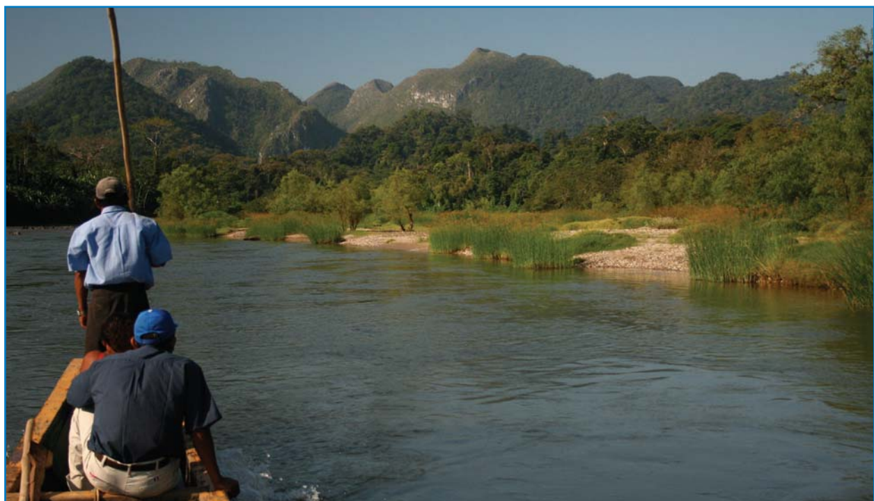
El río Coco constituye la frontera entre Nicaragua y Honduras.

Son varias las amenazas para las aves, siendo las principales la pérdida de hábitat por la deforestación y, en algunos casos específicos, la cacería tanto comercial (para exportación) como de subsistencia (Martínez-Sánchez et al. 2001). La causa subyacente de estos problemas es la falta de protección real de los hábitats importantes. Otras amenazas son la pérdida de humedales por la explotación excesiva del agua para la agricultura, la expansión de granjas camaroneras, la contaminación de humedales por el uso de agroquímicos y la falta de conciencia ambiental.