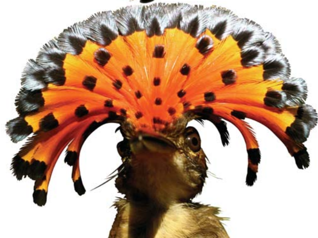
Cazamoscas real norteño ( Onychorhynchus mexicanus )

Al menos 59 especies de aves están restringidas a biomas o regiones zoogeográficas en Nicaragua; según Stotz et al. (1996), América Latina está formada por 22 biomas, de los cuales tres se encuentran en Nicaragua: Tierras Altas de Sierra Madre (MAH), Vertiente Árida del Pacífico (PAS) y Vertiente del Golfo del Caribe (GCS).